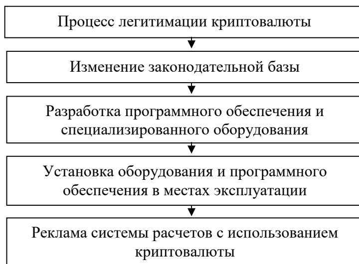
Рис. 2. Этапы процесса легитимации криптовалюты

Легитимация криптовалюты в национальной платежной системе. Для реализации потенциала электронных денег необходима их легитимация как элемента национальной платежной системы России. Решение этой задачи предполагает реализацию ряда этапов (рис. 2).