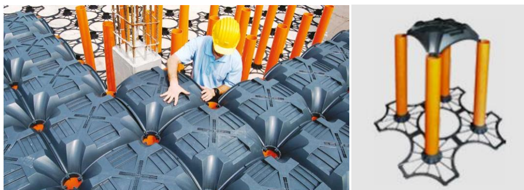
Рис.1. Опалубка Novyu Elevetor

Введение. Novyu Elevetor — это несъемная опалубка, но, в отличие от того же полистирола, ее преимущество заключается в том, что сохраняется возможность доступа к коммуникациям, то есть можно обслуживать трубы и прочее оборудование (рис. 1.) [1]. По сути это система из вертикальных труб и горизонтальных элементов из полипропилена. Так как и снизу, и сверху все элементы скреплены, система достаточно устойчива, после бетонирования получается кессонная плита. Система может быть использована для наклонных поверхностей (до 14 градусов). Область применения очень широка, поверху можно устраивать, например, зелёную кровлю или использовать данную систему для звукоизоляции, например для настила в спортивных залах [2]. Цель данной статьи — рассмотреть преимущества нового вида опалубки Novyu Elevetor, возможные области ее применения.