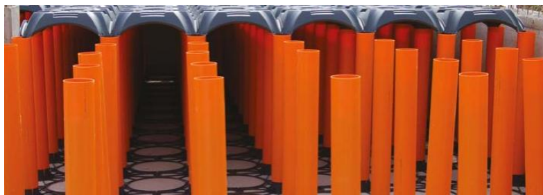
Рис. 2. Трубы ПВХ

— система Novyy Elevetor идеально подходит для фундаментов с вентилируемой плитой из железобетона в жилых, коммерческих и промышленных зданиях. Система состоит из опалубки, труб из ПВХ и запатентованной решетки, которая обеспечивает идеальную вертикальность изделия, гарантируя отличную несущую способность. Сборная система предусматривает укладку на сухую опалубку, в результате чего создается полностью пригодная для хождения самонесущая поверхность, готовая к заливке. По завершении заливки и после отверждения бетона получается несущее перекрытие, вентилируемое во всех направлениях [4];