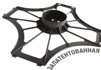
Рис. 3. Базовая решётка