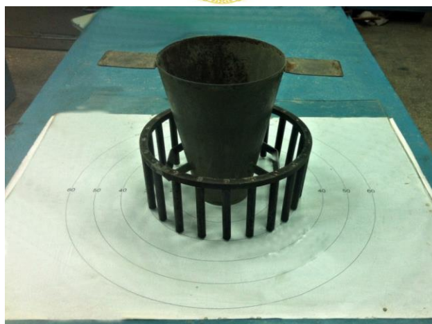
Рис. 1. Прибор для определения растекаемости и реологических характеристик самоуплотняющихся бетонных смесей

Анализ и оптимизация зернового состава заполнителя для мелкозернистого самоуплотняющегося бетона. В ходе исследований проанализирован зерновой состав мелких заполнителей, установлена оптимальная дозировка отсева камнедробления для обогащения очень мелких природных песков. Зерновой состав песков и отсева камнедробления представлен в табл. 2, а кривые просеивания — на рис. 2.