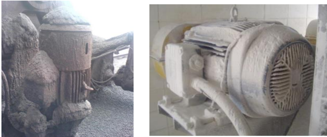
Рис. 1. Примеры электродвигателей, эксплуатируемых в условиях сильных загрязнений

теплоотдачу с поверхности оборудования, что повышает вероятность его перегрева; загрязнения, скапливающиеся на поверхности, при определенных условиях способны проникать внутрь корпуса, что уже создает возможность для нарушения минимальных диэлектрических промежутков, что чревато аварийными ситуациями и отказами; загрязнения маскируют более существенные дефекты: трещины, сколы, нарушения герметичности, ослабление креплений, следы электрического пробоя, термические повреждения (обгорание краски, цвета побежалости металла, оплавление, обгорание пластика). Очистка требуется, чтобы убедиться в отсутствии или наличии таких дефектов. Примеры электродвигателей, эксплуатируемых в условиях сильных загрязнений, показаны на рис. 1.