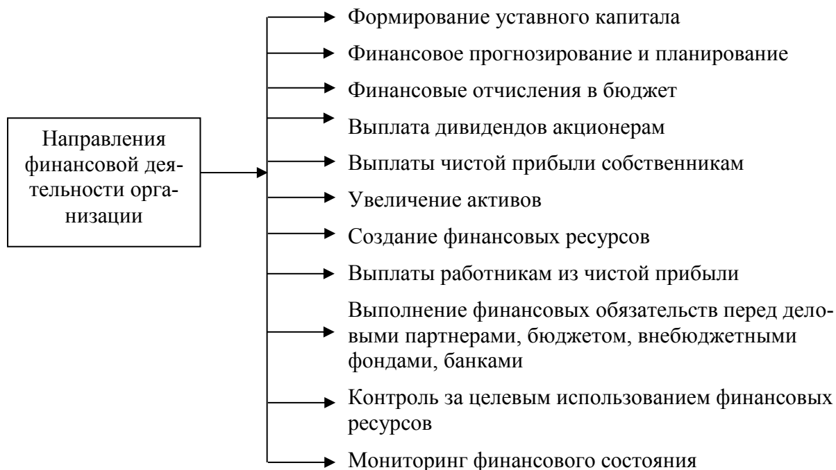
Рис. 1. Направления финансовой деятельности организации [1]

Основные направления финансовой деятельности и значение их эффективного осуществления для региональной экономики. Финансовая деятельность организации включает целый ряд взаимосвязанных направлений (рис. 1).