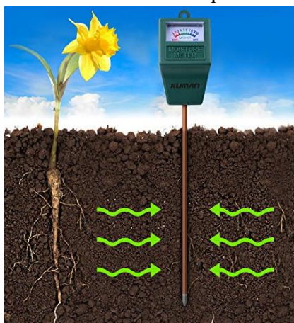
Рис. 1. Анализатор влажности

В настоящее время крупные производства пользуются электровлагомерами самых разнообразных марок, одним из них является анализатор влажности «Элвиз-2» (рис. 1).