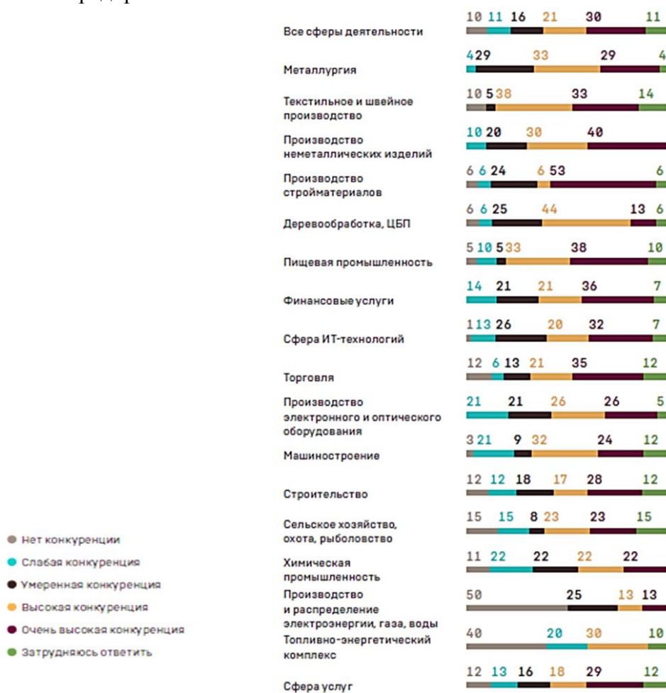
Рис. 2. Состояние конкуренции в различных отраслях экономической деятельности