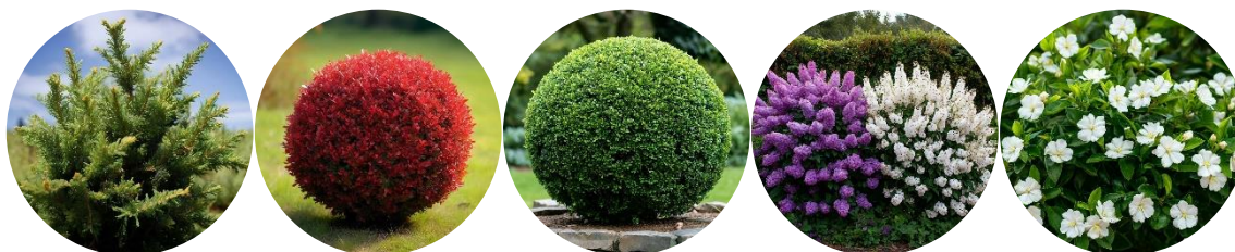
Рис. 12. Кусты, рекомендуемые для создания проекта

– кусты: можжевельник, барбарис, самшит, сирень сиреневая, сирень белая, жасмин (рис. 12).