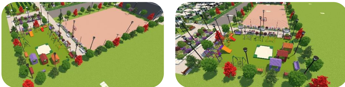
Рис. 4. Второй и третий участок

Вторым и третьим участками парка являются баскетбно-волейбольная площадка и детская площадка. Предлагается соединить две площадки в одну (рис. 4).