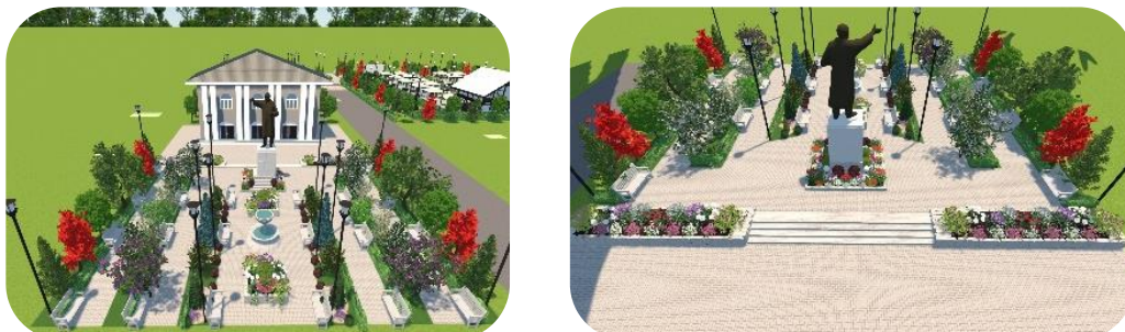
Рис. 3. Первый участок

В построенной визуализации парк представляет собой пространство, разделенное на несколько зон. Первый участок — аллея перед входом в ДК Маяковский. На данный момент она находится в плачевном состоянии. На этом участке с помощью 3d визуализации размещены шесть зон с деревьями и газоном, огороженные живой изгородью, пять клумб и фонтан (рис. 3).