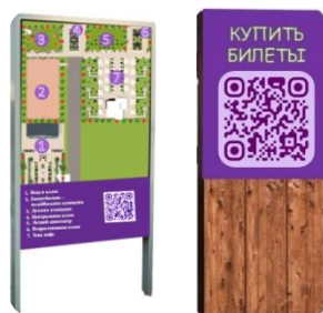
Рис. 21. Информационная доска и qr-код для покупки билетов

Заключение. Несмотря на большой темп развития и разрастания современных городов, они недостаточно укомплектованы парками и зонами отдыха. Желание внести свою лепту в решение хотя бы небольшой части данной проблемы, связанной с отсутствием мест проведения досуга и отдыха, подтолкнуло авторов к созданию данного проекта. Авторы проекта надеются на реализацию описанных идей в будущем и на возможность насладиться прогулками по отреставрированному парку. При создании проекта были учтены все регламентирующие документы. Проект может послужить прообразом для благоустройства парков и зон отдыха в других городах.