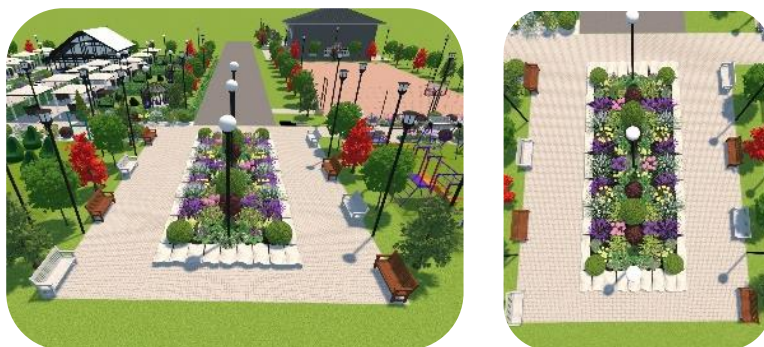
Рис. 5. Четвертый участок

Четвертый участок. Назовём её центральная аллея. На этом участке предлагается расположить большую клумбу и лавочки (рис. 5).