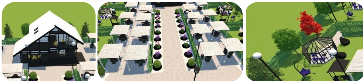
Рис. 8. Зона кафе

Седьмой участок — зона кафе. В неё входят помещение кафе, крытые столики на улице (мини-террасы) и VIP, в которую входят: беседка, мангал, место для отдыха рядом с беседкой и садовые качели (рис. 8).