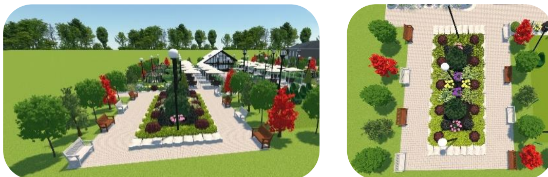
Рис. 7. Второстепенная аллея

Шестой участок — второстепенная аллея. На нем также предлагается разместить большую клумбу и скамейки (рис. 7).