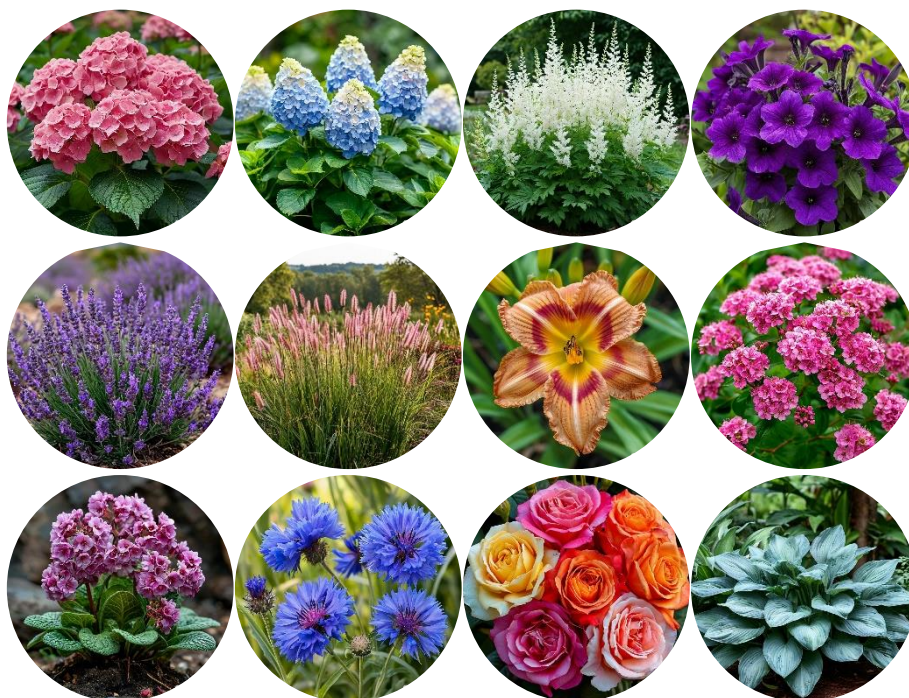
Рис. 3. Цветы, рекомендуемые для создания проекта

– цветы: гортензия крупнолистная, гортензия метельчатая, астильба, петунья, лаванда, перистоштитник, розы, хоста, спирея, бадан, лилейник (рис. 13).