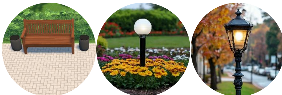
Рис. 15. Скамейки и освещение

Завершающим этапом проекта является установка освещения, монтаж скамеек и урн. Для аллеи рекомендованы деревянные скамейки, фигурные фонари для ночного освещения и шаровидные фонарики для подсветки клумб (рис. 15).