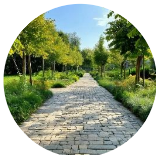
Рис. 10. Дорожка из тротуарной плитки

В качестве материала для прогулочных дорожек в проекте рекомендовано использовать тротуарную плитку (рис. 10).