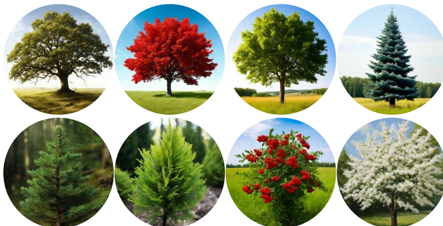
Рис. 11. Деревья, рекомендуемые для создания проекта

– деревья: дуб, дуб красный, клён, ель голубая, ель, туя западная, рябина, черемуха (рис. 11).