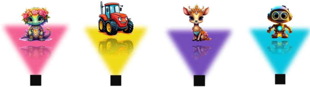
Рис. 18. Детские голограммы

На детской площадке голограммы будут связаны с популярными мультфильмами. За дополнительную плату можно будет сменить голограмму одного мультфильма на любой другой мультфильм из предложенных (рис. 18).