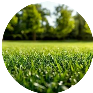
Рис. 14. Газонная трава

Завершающим этапом проекта является установка освещения, монтаж скамеек и урн. Для аллеи рекомендованы деревянные скамейки, фигурные фонари для ночного освещения и шаровидные фонарики для подсветки клумб (рис. 15).