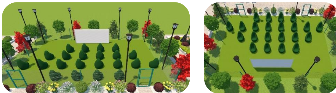
Рис. 6. Летний кинотеатр

Пятый участок — летний кинотеатр. В проекте есть место для воплощения очень интересной зоны отдыха в виде летнего кинотеатра. Так как в городе нет таких кинотеатров, предположим, что данная идея будет востребованной (рис. 6).