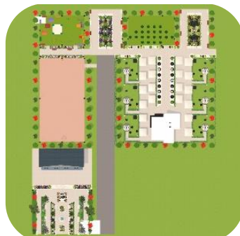
Рис. 2. Парк 3D визуализация

Используя результаты подготовительных работ, была выполнена 3D визуализация в программе ландшафтный дизайн 3D (рис. 2).