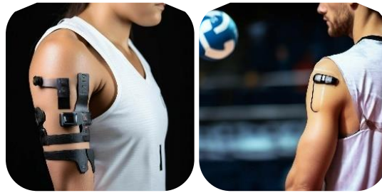
Рис. 17. Примеры датчиков для спортсменов

На детской площадке голограммы будут связаны с популярными мультфильмами. За дополнительную плату можно будет сменить голограмму одного мультфильма на любой другой мультфильм из предложенных (рис. 18).