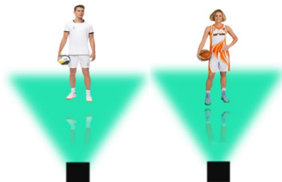
Рис. 16. Пример голограмм тренеров

Голограммы предлагается установить на спортивных и детских площадках. На спортивной площадке они будут изображать тренера, который может быть мужчиной или женщиной (рис. 16).