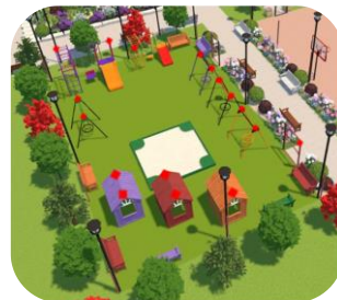
Рис. 20. Места установки датчиков безопасности отмечены красными квадратами

Внедрение подобных технологий на детской площадке поможет улучшить ее безопасность, сделает игру более комфортной и спокойной для родителей (рис. 20).