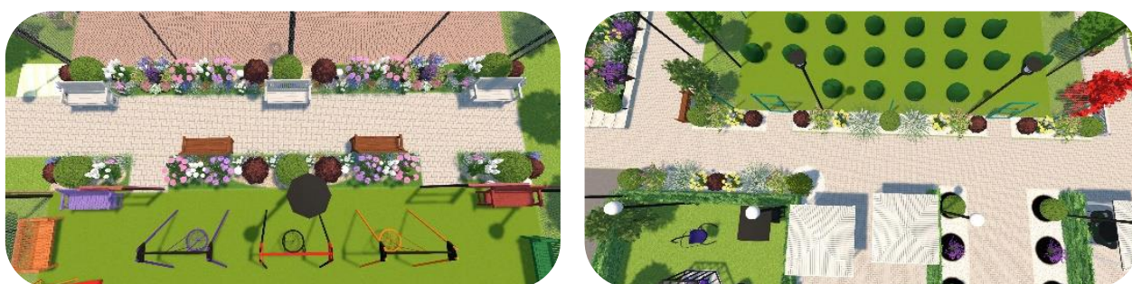
Рис. 9. Зона кафе

Восьмой и девятый участки — мини-аллеи. Участки являются не главными, но нужными. Первая мини-аллея находится между баскетбольно-волейбольной и детской площадками, а вторая — между летним кинотеатром, второстепенной аллеей и зоной кафе (рис. 9).