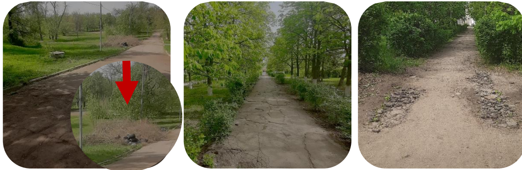
Рис. 1. Состояние парка на данный момент

После изучения частей парка, произвели фотосъемку зон, которые планируется оживить, произвели замеры (рис. 1).