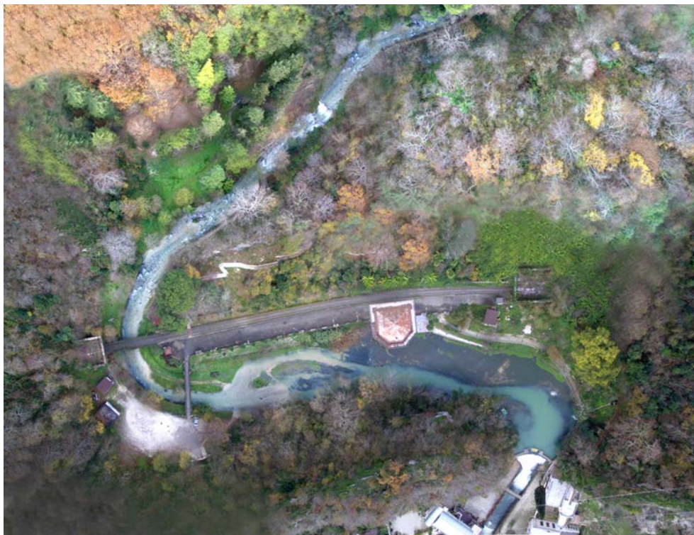
Рис. 1. Вид сверху на станцию «Псырцха» и прилегающую территорию

Круглый год её посещают сотни тысяч людей, но, к сожалению, станция, как и вся территория, находится в плохом состоянии (рис. 1).