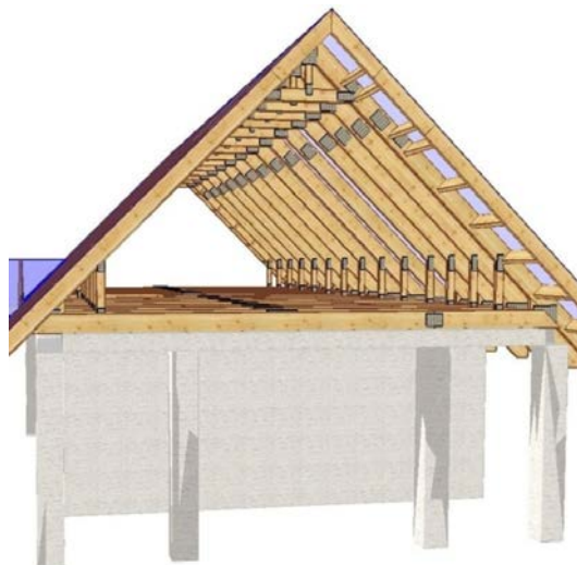
Рис. 3. Двускатная кровля

Для усиления конструкции применяют различные подпорные и поддерживающие элементы. Основным из них является стропильная система. Уклон двускатной крыши обычно принимается не более 45 градусов. Устройство кровли начинают с создания эскизов основания кровли — соединяют, согласно проекту, доски между собой под углом, закрепляют их, наносят отметки для вырезов возле стен и мауэрлата. После этого производят сборку стропил на земле, а затем готовые стропила поднимают на крышу. Установка стропил происходит с крайних стропил, которые должны быть симметричны. После этого устанавливаются опорные стойки на расстоянии 60–100 см. Они распределяют нагрузку на несущие стены здания. Далее следует установить стропила по всему каркасу здания, дополнительно фиксируя их стойкой и длинными шурупами или шпильками диаметром 12 мм. Для увеличения надежности и жесткости конструкции на крайние стропила и стропы устанавливают ригели и закрепляют их по всей площади крыши, а также в верхней части стропила фиксируют железным уголком.