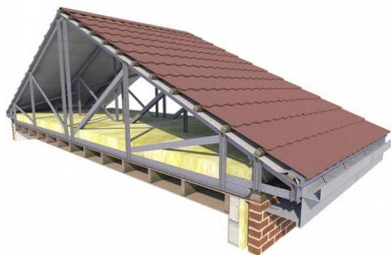
Рис. 1. Общий вид кровли

Keywords: inclined roofing, lean-to, duo-pitch, hipped, pyramidal, mansard and domed roof.