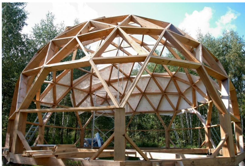
Рис. 7. Купольная кровля

Купольные кровли , они же канонические или сводчатые. Данный тип кровли используется для домов больших размеров (рис. 7). Основные преимущества такой кровли в том, что всегда используется полезная площадь (пространство между покрытием и перекрытием этажа), а также с помощью такой кровли можно создать необычный дизайн за счет изломов кровли. Сложность данной кровли состоит в ее ломанной стропильной конструкции, сложности соединения стропильной системы и обрешетки. Конструкция такой кровли состоит из треугольных элементов, собранных из бруса, которые в последствии соединяются между собой металлическими пластинами.