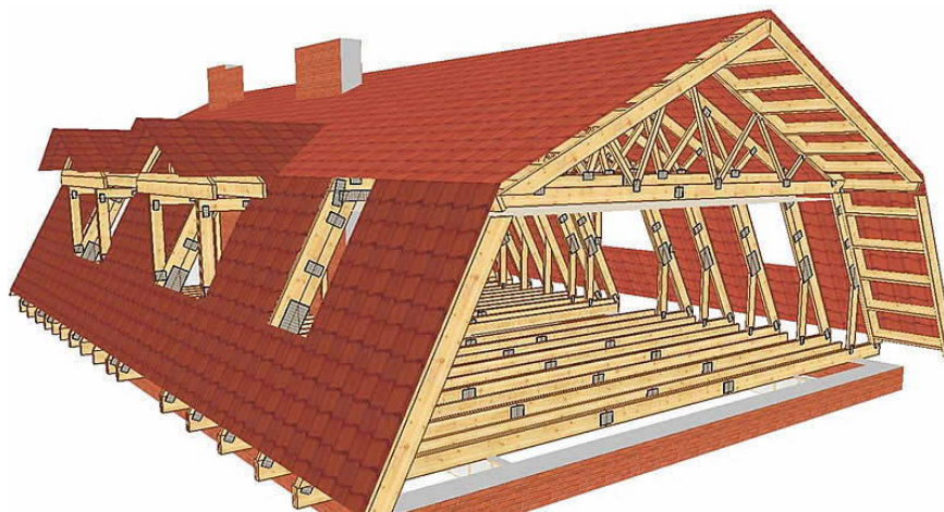
Рис. 6. Мансардная кровля

пирога, меньше нагрузка на фундамент. Для устройства такой крыши используют два типа стропильных систем: висячие стропила и наклонные. В системе с наклонными стропилами применяют дополнительные опоры стойки, прогоны и ригели.