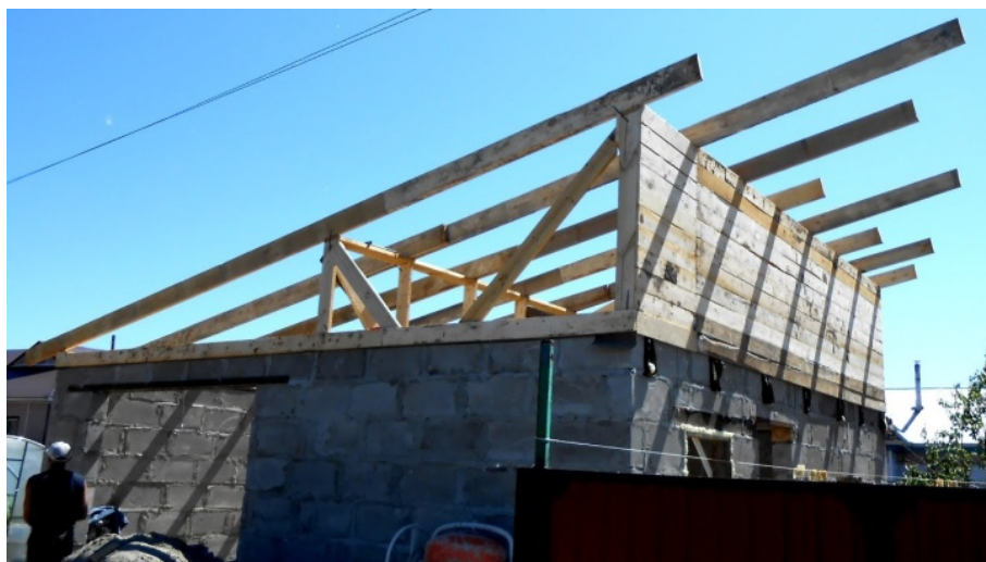
Рис. 2. Однокатная кровля

Однокатные кровли — это один из самых простых и экономичных в плане устройства крыши вариант (рис. 2). Однокатные кровли в большей степени применяют при строительстве индивидуальных жилых домов, бань, гаражей, сараев, беседок и террас.