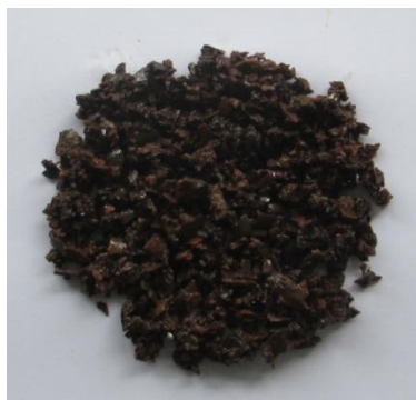
Рис. 2. Скорлупа ореха анакарда, фракция 3–6 мм