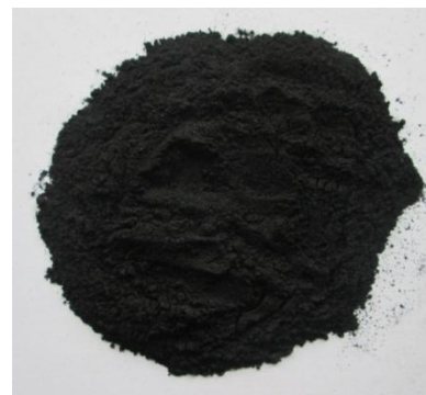
Рис. 3. Углеродный сорбент из скорлупы ореха анакарда, фракция 0,16 мм