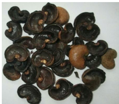
Рис. 1. Скорлупа ореха анакарда

Скорлупа ореха анакарда содержит масло, которое называется Cashew Nut Shell Liquid (CNSL). Предварительно необходимо извлечь масло (CNSL) из скорлупы ореха анакарда, так как при её горении выделяются пары кислот, вредные для человека и окружающей среды [11].