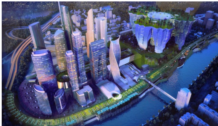
Рис. 2. Цифровой двойник города Москвы — иллюстрация из статьи «Института Территориального Планирования ГРАД» [3]

граммы SpaceMaker и Finch, в которых реализованы алгоритмы машинного обучения для автоматической генерации планировочных решений и элементов градостроительных концепций с учётом множества параметров [1]. В контексте цифровой трансформации управления жизненным циклом капитальных объектов получают распространение цифровые двойники (Digital Twin) [2]. Данная практика позволяет повысить качество городской среды и эффективнее использовать городские ресурсы. Так, для Москвы создан цифровой аналог с элементами искусственного интеллекта (рис. 2), который моделирует сценарии планирования застройки и предварительно оценивает влияние нового объекта на транспортные сети городского хозяйства [3].