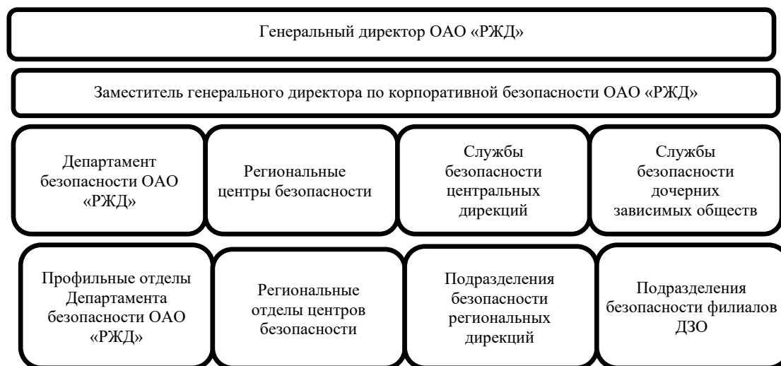
Рис. 1. Субъекты системы обеспечения безопасности ОАО «РЖД»

Особую роль в системе обеспечения экономической безопасности играют региональные центры безопасности, чья организационная структура демонстрируется на рис. 1.