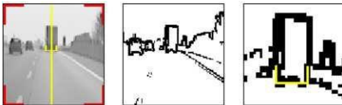
Рис. 3. Пример распознавания нижней границы объекта

Данная система распознавания нижней границы основана на жесткой работе, это означает, что в условиях бездорожья она работать не будет.