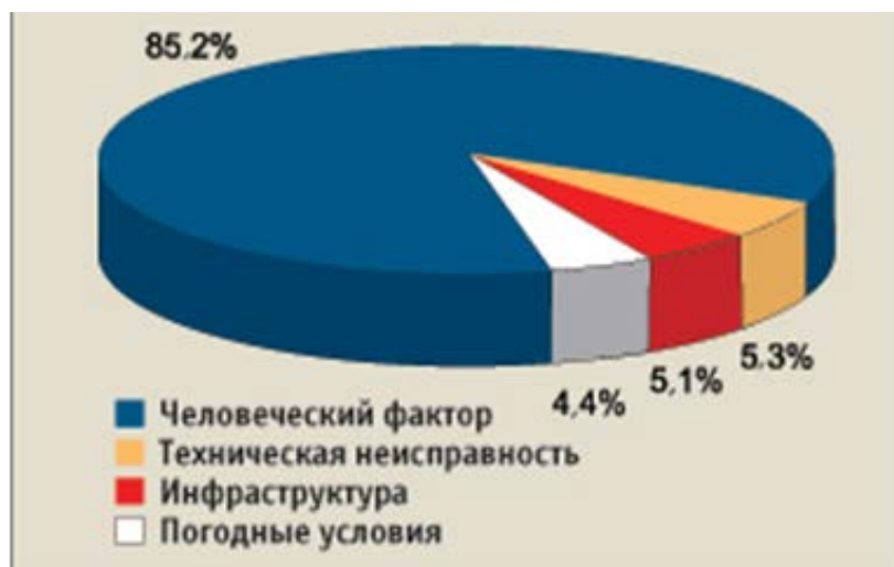
Рис. 4. Основные причины ДТП

именно поэтому так важно их техническое состояние. Однако, принимая во внимание данные о ДТП, следует сказать, что многие проблемы связаны с человеческим фактором (рис. 4).