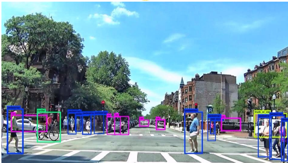
Рис. 1. Пример работы датчика температуры

В Spirit Berlin, помимо 3D-сканера, подразумевается использование нескольких камер, которые расположены на борту автомобиля. Камеры выполняют две основные функции.