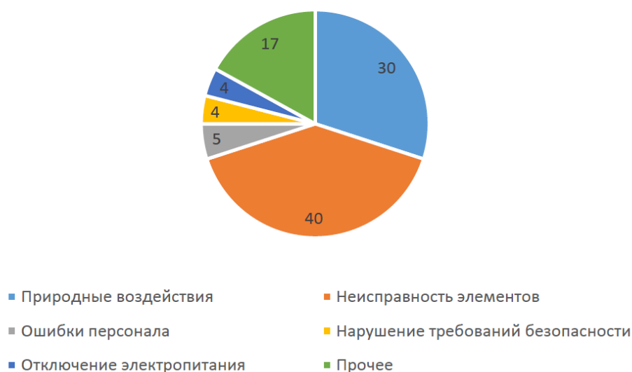
Рис. 1. Частота (%) фиксируемых причин аварий при эксплуатации ППКД

По данным Ростехнадзора, самая частая причина аварий на ППКД — неисправность элементов системы (рис. 1).