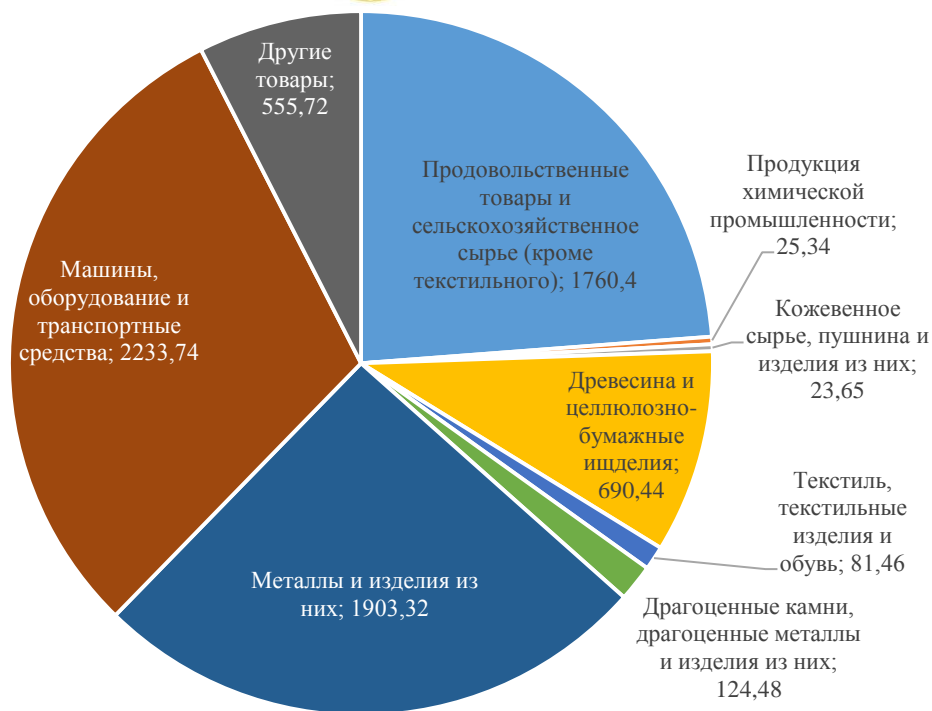
Рис. 2. Товарная структура экспорта России в страны СНГ в январе-июне 2016 г., млн долл.

Основу отечественного экспорта в дальнее зарубежье составляли топливно-энергетические товары (за первое полугодие 2016 г. объемы экспорта сырой нефти выросли на 6,1%, природного газа на 14,6%, каменного угля на 9,3%).