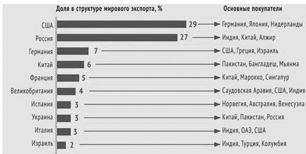
Рис. 3. Страны-лидеры по экспорту вооружений на мировом рынке (2016 г.)

Выступая на расширенном заседании фракции «Единая Россия», председатель правительства Российской Федерации Д. А. Медведев рассказал о темпах выполнения государственного оборонного заказа, а также об объемах экспорта российских вооружений. По словам Д. А. Медведева, экспорт российской военной техники и оружия в 2016 г. принес бюджету 15 млрд долл. [3].