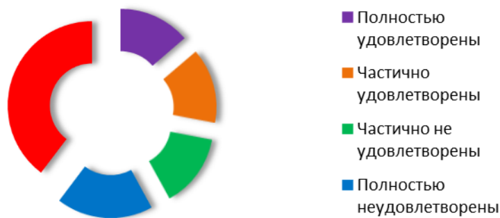
Рис. 2. Удовлетворенность молодежи работой клубных учреждений

Возникла заинтересованность о причине большого количества отрицательных ответов. Поэтому были заданы еще несколько вопросов.