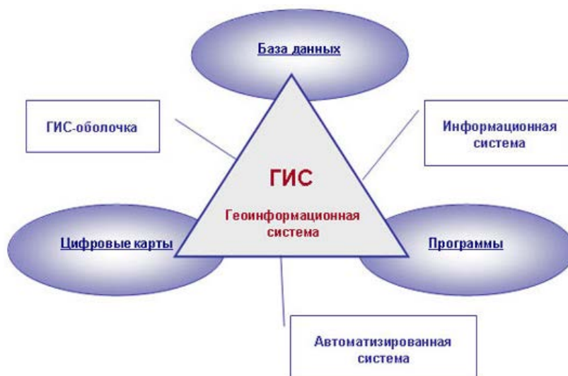
Рис. 1. Тематические слои в ГИС

Введение. Геоинформационная система (ГИС) — это современная компьютерная технология для картирования и анализа объектов и событий реального мира. Пространственная информация в ГИС организована в виде слоев, каждый из которых представляет собой цифровую модель, построенную на объединении объектов, имеющих общие свойства или функциональные признаки (рис. 1).