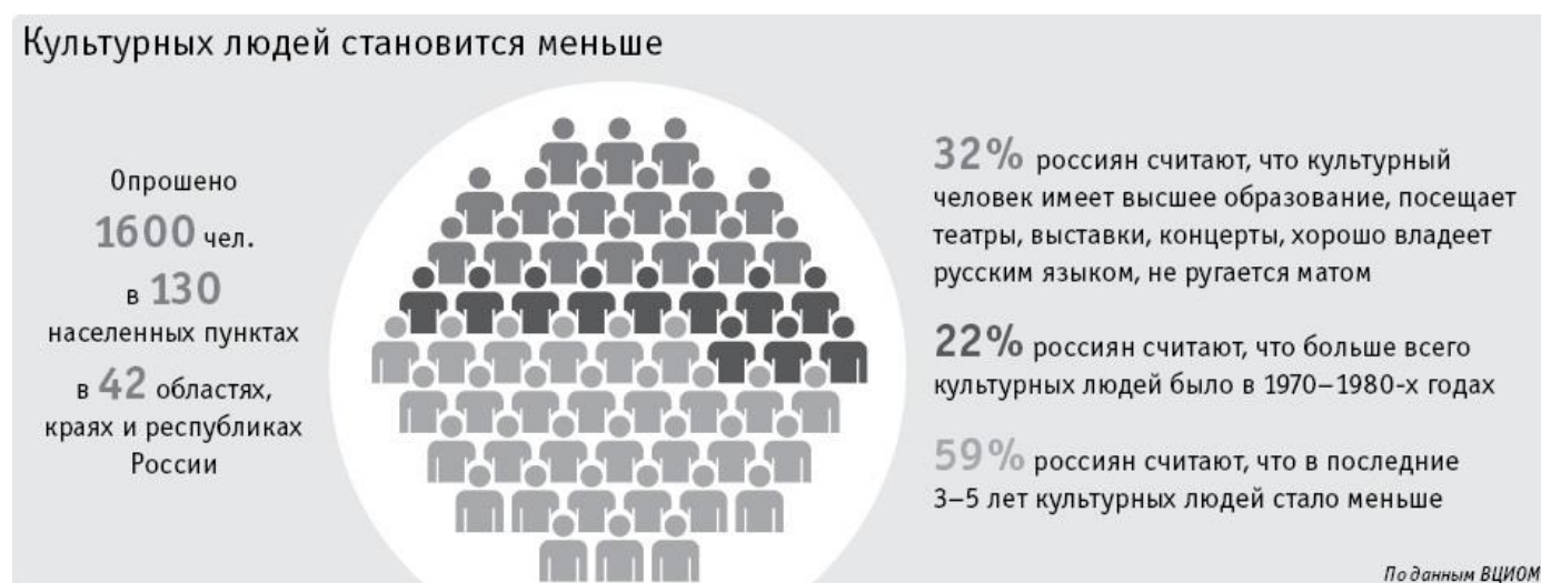
Рис. 3. Результаты опроса ВЦИОМ на тему «Развитие культуры в РФ» [4]

За последние несколько лет сформировалось отношение к культуре как к сфере услуг, следовательно, целью управленческих решений в данной отрасли является не воспитание и просвещение человека, а «взращивание квалифицированного потребителя». Данные социологических опросов населения России уже демонстрируют перекося установок общественного сознания в сторону внешней атрибутики «культурного человека» (рис. 3).