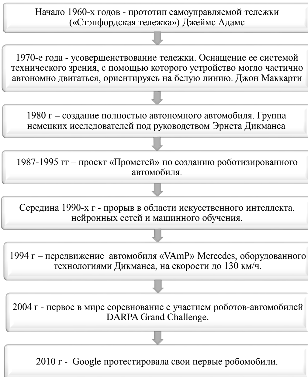
Рис. 1. История развития беспилотных автомобилей

В настоящий момент большое количество автопроизводителей по всему миру делают серьезную ставку на беспилотные автомобили [1, 2].