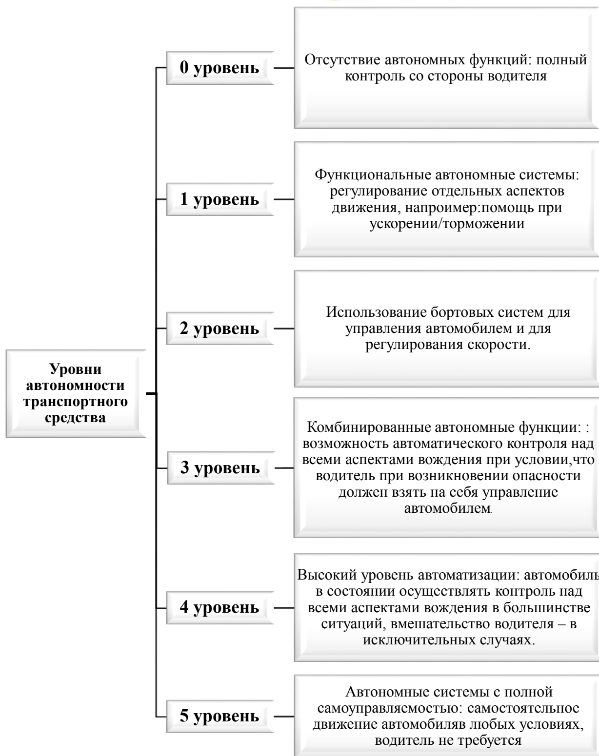
Рис. 2. Уровни автономности автомобиля

Прототип системы управления для беспилотного транспорта смонтирован на базе серийного полноприводного автомобиля КамАЗ-5350 и прошел первые испытания.