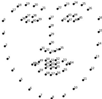
Рис. 1. Расположение антропометрических точек на лице

Нахождение антропометрических точек лица. Метод базируется на учете статистических связей между расположением антропометрических точек лица. Всего выделяется 68 точек: подбородок, внешние края глаз, края бровей, кончик носа и так далее (рис. 1).