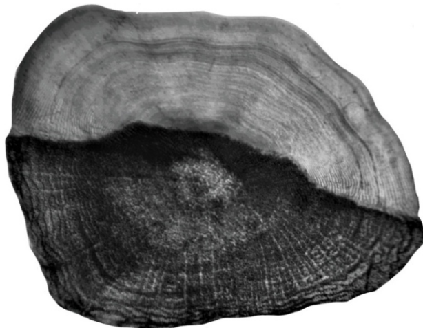
Рис. 3. Головной морфотип (проба № 1)

поверхности. Центр (место начала формирования чешуи в онтогенезе) сдвинут в каудальном направлении, либо расположен посередине чешуи. Склериты идут параллельно краю чешуи и повторяют ее контуры, имеются почти на всей поверхности (утеря некоторых на каудальном поле). Радиальные лучи слабо развиты или отсутствуют (простые чешуи). Обычно простые чешуи покрывают только голову рыбы. Ктении отсутствуют. Чешуи, прободенные порами сейсмодатчика, не обнаружены.