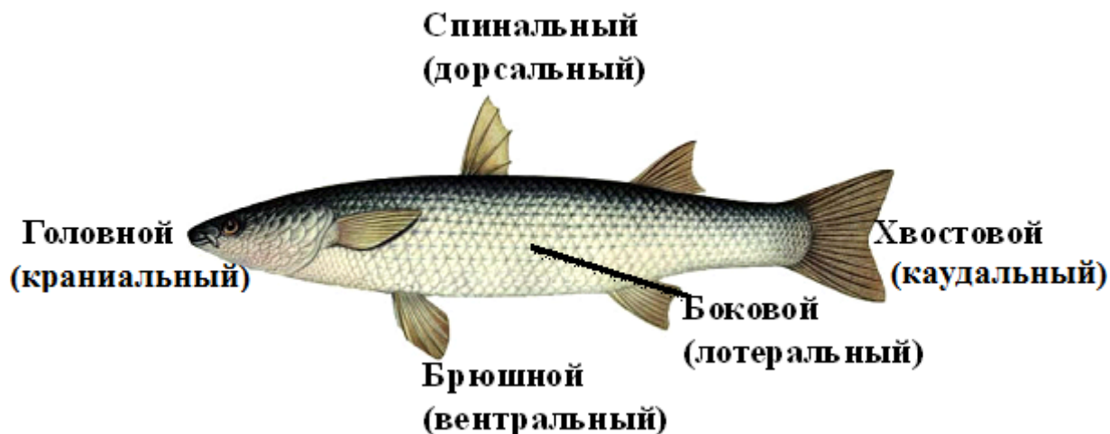
Рис. 2. Локализация морфотипов чешуи пиленгаса

Результаты исследования. Чешуя пиленгаса была классифицирована на несколько морфотипов, локализованных на разных участках чешуйного покрова (рис. 2).