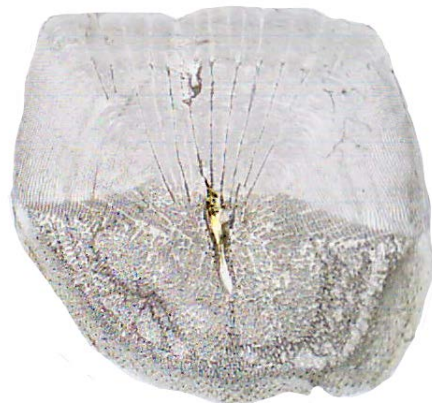
Рис. 7. Хвостовой морфотип (проба № 11)

всей поверхности (утеря некоторых на каудальном поле). Волнистость краниального края поверхности чешуи обусловлена радиальными лучами. Радиальные лучи присутствуют только на краниальном поле, расходятся от центра к краям чешуи. Нервный канал четко выражен.