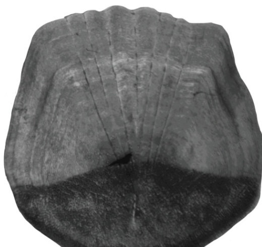
Рис. 4. Спинальный морфотип (проба № 5)

Спинальный (дорсальный) морфотип. Чешуя ктеноидная (рис. 4), имеет вид тонкой гладкой пластинки овальной или округлой формы. Краниальное поле занимает около 70 %, каудальное — 30 % поверхности. Центр сдвинут в каудальном направлении. Склериты идут параллельно краю чешуи и повторяют ее контуры, имеются почти на всей поверхности (утеря некоторых на каудальном поле). Волнистость краниального края поверхности чешуи обусловлена радиальными лучами. Радиальные лучи присутствуют только на краниальном поле, расходятся от центра чешуи (разделенные чешуи). Сейсмодатчик на прободенных чешуях четко выражен.