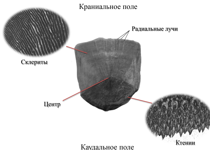
Рис. 6. Ктеноидная чешуя

Боковой (латеральный) морфотип. Чешуя ктеноидная с цельными ктениями, представленными в виде «зубов», «когтей» (рис. 6). Имеет вид тонкой гладкой пластинки овальной или округлой формы. Краниальное поле занимает около 60–70 % поверхности. Центр сдвинут в каудальном направлении. Склериты идут параллельно краю чешуи и повторяют ее контуры, имеются почти на всей поверхности (утеря некоторых на каудальном поле). Волнистость краниального края поверхности чешуи обусловлена радиальными лучами. Радиальные лучи присутствуют только на краниальном поле, расходятся от центра к краям чешуи. Нервный канал обнаружен не на всех изученных чешуях.