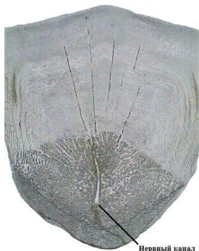
Рис. 5. Брюшной морфотип (проба № 7)

(разделенные чешуи). Краниальный край волнистый с ярко выраженным гребнем в центре. Ктения проявляются в виде бугорков. Нервный (сейсмосенсорный) канал четко выражен (рис. 5).